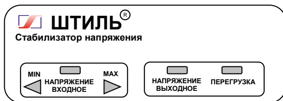
Рисунок 4.1 Передняя панель стабилизатора

На одной боковой стенке стабилизатора расположена розетка с заземляющим контактом для подключения нагрузки, а на другой – автоматический предохранитель 2А (у стабилизатора R250ST) или 5А (у стабилизаторов R400ST, R600ST), или 10А (у стабилизатора R800ST), выключатель СЕТЬ и выведен сетевой шнур для подключения стабилизатора к сети.